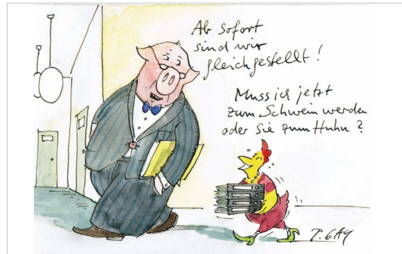
Illustration: Peter Gaymann